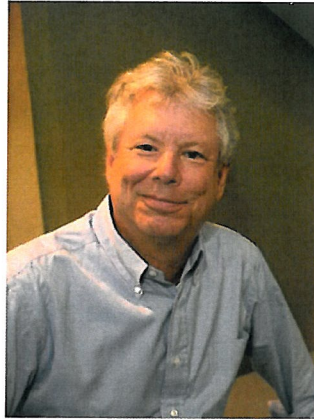
Richard H. Thaler